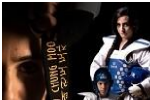
Kamptræning og sparring før NM 2016

Som forberedelse til Nordiske Mesterskaber 2016 vil Risskov Taekwondo Klub gerne invitere til fælles kamptræning og sparring for kadetter og juniorer.